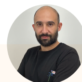
Yoan Coach personnel

Votre formatrice attitrée et experte dans son domaine animera les classes virtuelles et abordera avec vous, les thématiques les plus demandées.